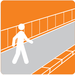
Пешачки патеки на мостови

За завршна заштита и декоративна обработка на бетонските површини изложени на лесен пешачки сообраќај, атмосферски влијанија и хемиска агресија.